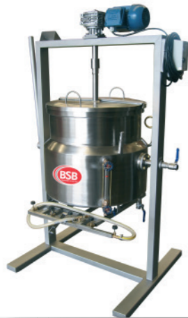
TACHO PARA DOCE