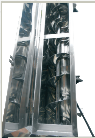
TRANSPORTADOR DE ROSCA