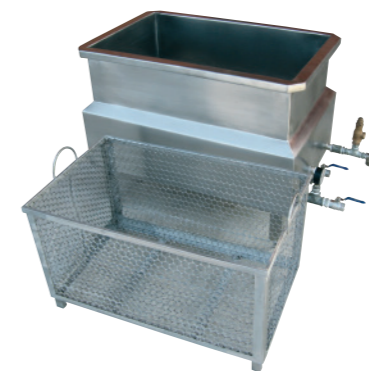
TANQUE COM CESTO