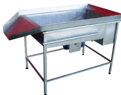
MESA DE BORBULHAMENTO