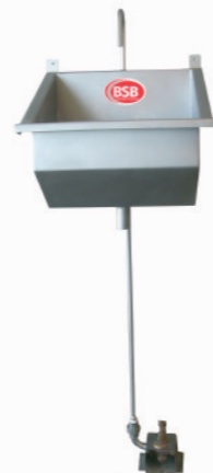
PIA LAVA MÃOS PEDAL INDIVIDUAL