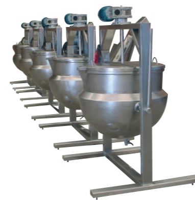
TACHOS SEMI HESFÉRICOS