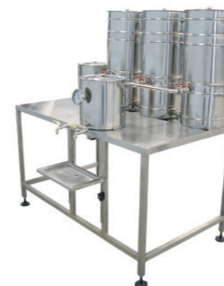
MINI USINA SUQUEIRA