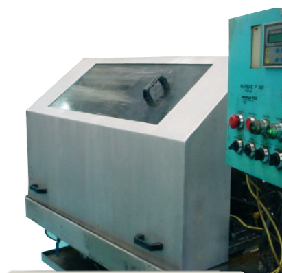
CAPOTA PARA MÁQUINAS