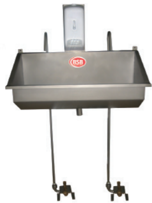
PIA LAVA MÃOS PEDAL 2 LUGARES