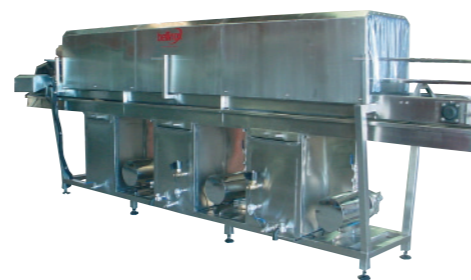
LAVADORA DE CAIXAS TRIPLA