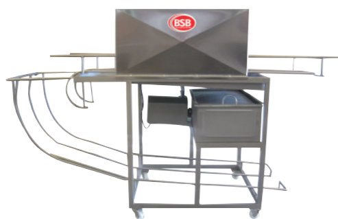
LAVADORA DE CAIXAS COM RETORNO