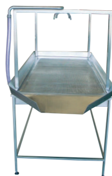
MESA DE ASPERSÃO