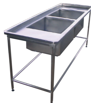
PIA 2 CUBAS GRANDES