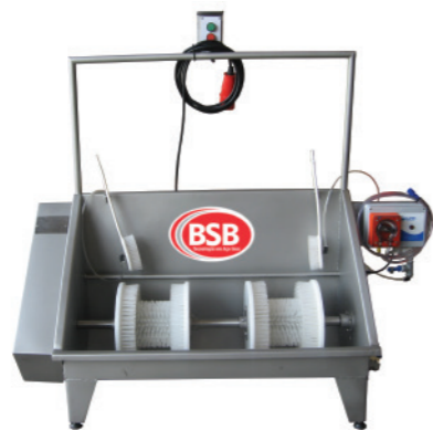
LAVA BOTAS 2 ESCOVAS SEMIAUTOMÁTICA