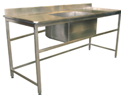
MESA COM CUBA